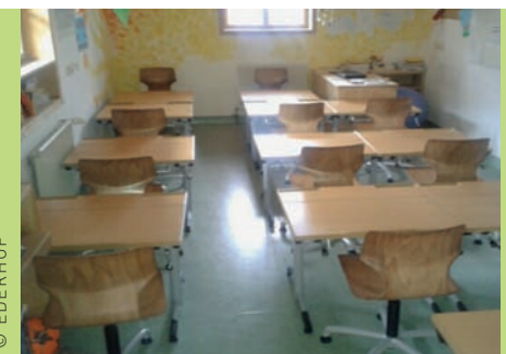
Wir danken Markus Wieser für wunderbare, neue Stühle und Tische

Doch genauso wichtig ist uns, dass die Kinder sich selbst als das wahrnehmen, was sie sind, nämlich Kinder, die Spaß und Freude am Leben haben sollen. Präventiv zu arbeiten, Wege und Möglichkeiten im sozialen Kontext aufzuzeigen, wird bei uns auf interdisziplinärer Ebene vollzogen. Ich freue mich auf mehr ...!